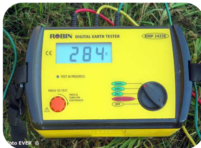
Foto : Eén aardingspin van 1,50m gaf te Diest een spreidingsweerstand van 284 Ω wat veel te hoog is. Een aarding voor een huishoudelijke installatie mag maar 30 Ω zijn ....

74,1 Ω aan wat feitelijk te hoog is, bij droogte kan die weerstand fel stijgen en dan valt de schrikdraadspanning vast en zeker weg. Wat ben je dan nog met zo'n zogenaamde wolfproof omheining?