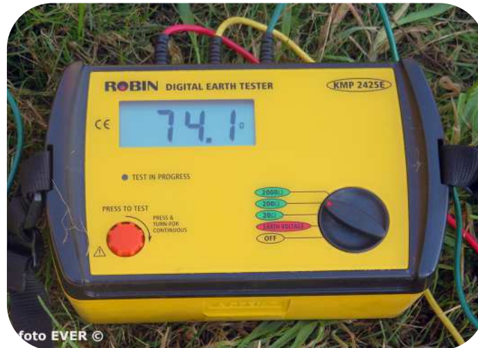
Foto : De totale spreidingsweerstand van de aarding klopt nagenoeg met de theoretisch berekende waarde - Wet van Ohm -, maar 74 Ω is voor een dergelijke aarding wel redelijk hoog.